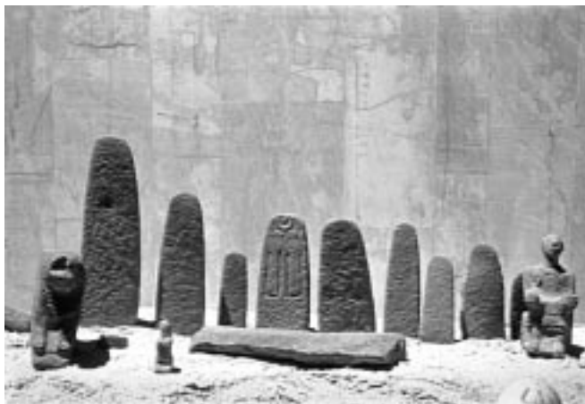
Культовые столбы хананеев в Асоре. Поздняя бронза

Могло ли в данном случае произойти реальное чудо? Естественно, что все силы природы находятся в руках Божьих, но, с другой стороны, Иисус, начавший бой в предрассветном сумраке, едва ли нуждался для победы в продлении дня. Битва при Гаваоне, скорее всего, описана языком героического эпоса со свойственными ему гиперболами, с помощью которых автор мог выразить основную мысль: Бог содействовал победе Иисуса.