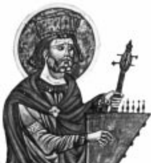
Царь Давид. Армянская миниатюра. XIII в.

2. Избрание Давида (1 Цар 16–17). Причиной отвержения Саула было его самоволие, отказ повиноваться пророку. Напрасно царь ссылался на жертвы, которыми он хотел умиловать Господа. «Неужели всесождения и жертвы, — говорит Самуил, — столько же приятны Господу, как послушание гласу Господа? Послушание лучше жертвы и повиновение лучше тука овнов. Ибо непокорность есть такой же грех, как волшебство, и противление — то же, что идолопоклонство. За то, что ты отверг слово Господа, и Он отверг тебя, чтобы ты не был царем» (15:22-23). Вместо