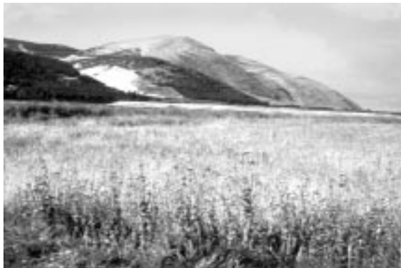
Палестина. Горы Гелвуйские, где погиб Саул (1 Цар 31:1)

Давид пленяет всех в окружении царя. Сын Саула Ионафан заключает с ним союз вечной дружбы, дочь Саула Мелхола ( Михаль ) выходит за него замуж. Давид оказывается не только талантливым музыкантом и певцом, но и одаренным полководцем. Царь дает ему военные поручения, ставит его во главе отрядов, и Давид неизменно одерживает победы. Постепенно в душу Саула закрадываются ревнивые подозрения. Триумф, с которым встречает народ нового победителя, настораживает царя. Не стремится ли его зять завладеть престолом? Но священный писатель ясно показывает, что Давид не мог помышлять об этом. Одной горячей привязанности к Ионафану было достаточно, чтобы Давид отклонял от себя такую мысль. Все совершается как бы помимо его воли.