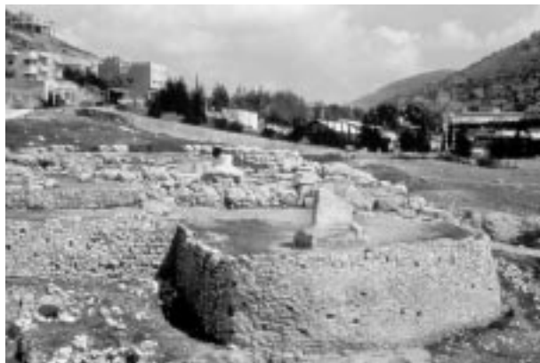
Сихем. Раскопки святилища. Культовый камень на переднем плане — возможный свидетель заключения Завета (Ис Нав 24:21-27)

Жители соседнего с Сихемом Гаваона, прибегнув к хитрости, сумели заключить с израильтянами союз. Они утаили, что живут в