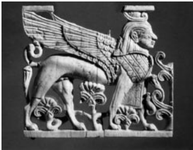
Херувим (керуб). Слоновая кость. Нимруд, Ассирия. Ок. IX—VIII вв. до Р. Х.

Девир , Святое Святых, был кубической комнатой, отделенной от святилища стеной и завесой. Там царила полная тьма и находился Ковчег, трон незримого Бога. Над ним простирали крылья два огромных изваяния. То были деревянные, обложенные золотом херувимы — небесные стражи с телом льва (или быка?), с человеческим лицом и орлиными крыльями. Мрак в Святое Святых напоминал о священном мраке Синая, о неприступности тайны Сущего. Когда Ковчег был перенесен туда, Соломон изрек: «Господь сказал, что Он благоволит обитать во мгле» (3 Цар 8:12).