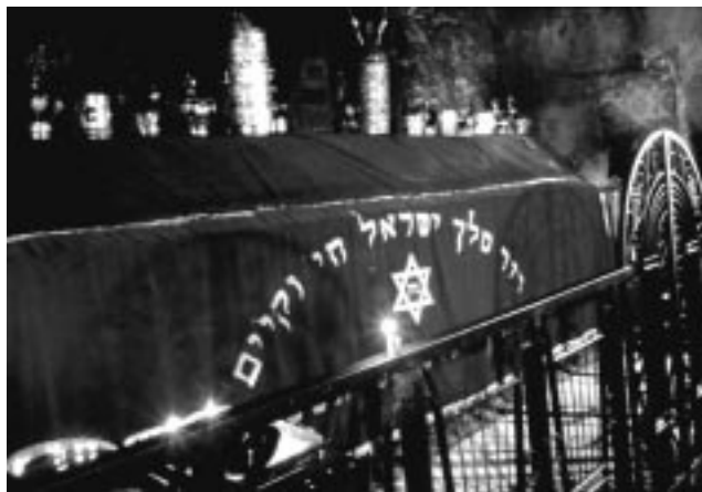
Гробница царя Давида на горе Сион (предполагаемое место захоронения)

Образ Давида, силой Божьей вознесенного на престол из неизвестности, человека, сердце которого было проникнуто верой, запечатлен в двух псалмах, не вошедших в еврейский канон. Греческий переводчик сократил их и слил воедино (151 неканонический псалом). Но