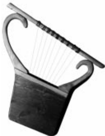
Арфа. На подобной арфе (киноре) играл Давид

Пусть Давид разделял многие представления своей эпохи, пусть он не всегда мог устоять перед искушениями, но он возвещал о Боге правды — Отце слабых и угнетенных, о Боге, Который требует милосердия и истины. Бог являет Себя в грозных знамениях, но Он не отдаляется от человека: подлинная молитва всегда достигает Его престола.