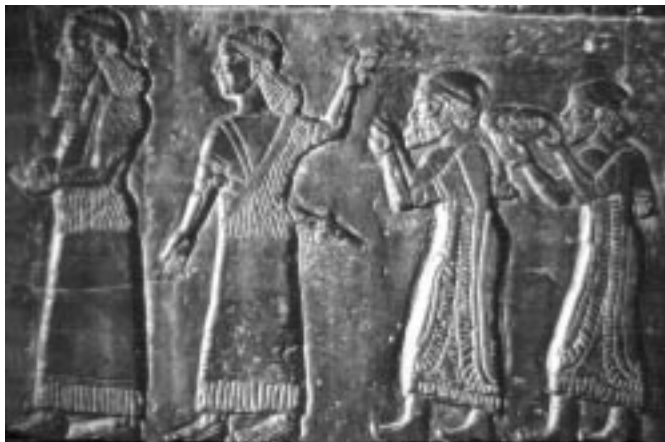
Израильские послы несут дань. С сирийского рельефа. IX в. до Р. Х.

Тяжелые последствия вызвал мятеж и в Иудейском царстве. Убийство царя Охозии едва не привело к гибели Давидовой династии. Царица-мать Аталия (Гофолия), дочь Омри, убив всех наследников, воцарилась в Иерусалиме единовластно. И лишь чудом преданные династии люди спасли ребенка Иоаса, сына Охозии, которого через семь лет удалось провозгласить царем.