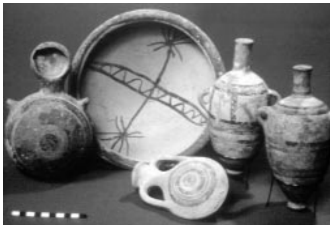
Керамика из Ханаана. XII в. до Р. Х.

Об этих кампаниях свидетельствуют следы опустошительных разрушений в ряде городов Ханаана XIII в. Так, например, раскопки Лахиса (Лахиша) указывают на пожар, уничтоживший город. Стены приняли темный цвет, как печь для обжига кирпичей. Стекланные предметы расплавились. Обломки слоновой кости почернели и обуглились. Найдены и остатки черепичной кровли храма, ко-