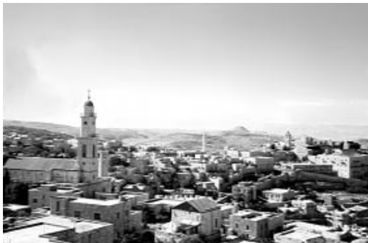
Вифлеем — родина царя Давида и город Рождества Христова