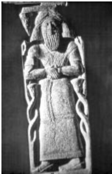
Статуэтка предположительно изображает сирийского царя Хазаэля (Азаила). Слоновая кость. Ок. 840 г. до Р. Х.

3. Пророк Елисей и иноплеменники. Как и сыны пророческие, Елисей настроен патриотически: он радуется военным победам израильских царей и скорбит о поражениях Израиля. Но в то же время ему свойственна открытость к иноплеменникам: он проявляет великодушие к сирийским пленным (6:11-23); идет по велению Божьему в Дамаск и предсказывает Хазаэлю, что он будет царем сирийским (8:7-15); исцеляет сирийского военачальника Неемана, при этом сурово наказывая своего слугу Гиезия за то, что он взял с Неемана плату (4 Цар 5).