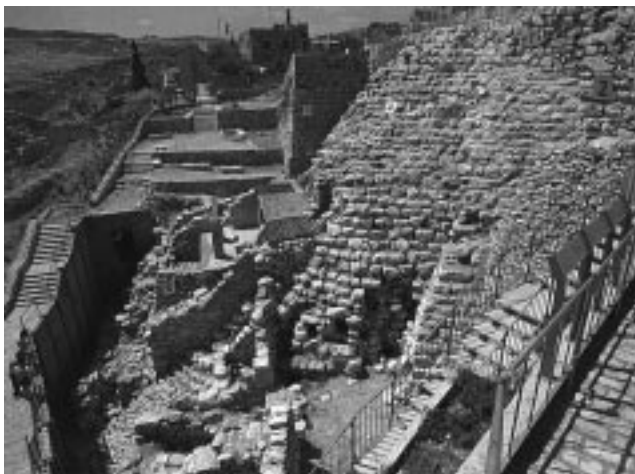
Иерусалим. Остатки иевуситской крепости. Гора Сион

Отныне Слава Яхве, сопровождавшая народ Божий в пустыне, будет пребывать в граде Давидовом.