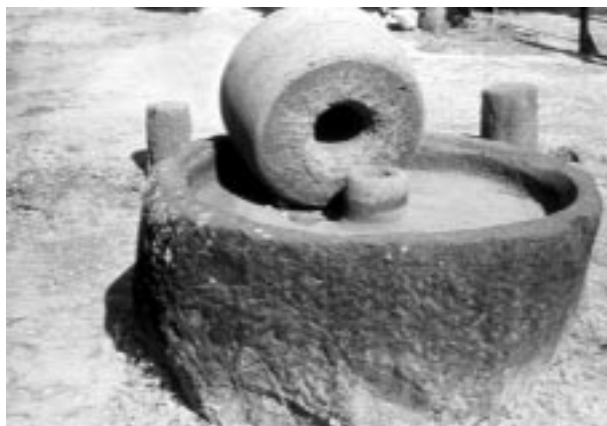
Масличный пресс из базальта. IX в. до Р. Х.

Самуил созывает народное собрание в Галгале, чтобы торжественно провозгласить Саула царем.