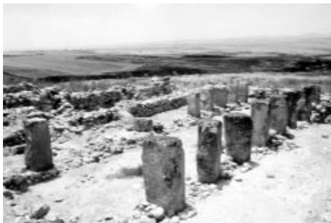
Развалины древних конюшен царя Соломона в Мегиддо

ких мастеров. Царь Хирам I прислал ему кедровое дерево и другие строительные материалы. Работа закончилась к 955 г. до Р. Х.