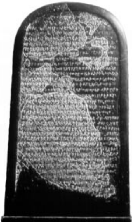
Стела моавитского царя Мешы (Меса) из Дивона, на которой описана война с Иорамом. 850 г. до Р. Х.

«Я Меша, сын Кемошкана, царь Моава Дибонец. Мой отец был царем Моава тридцать лет, и я воцарился по смерти отца моего; и построил это святилище Кемошу в Керихоте [в Библии — Кир-Харешет], свя-