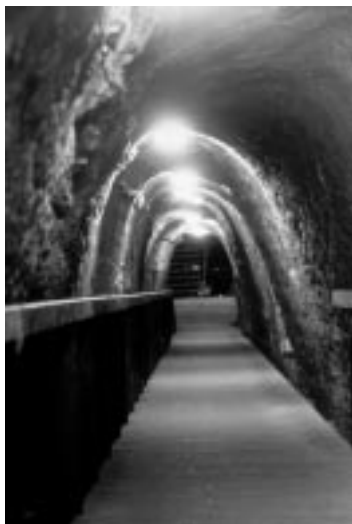
Туннель для снабжения города водой. Мегиддо. IX в. до Р. Х.

вот, Я сделаю по слову твоему. Вот, Я даю тебе сердце мудрое и разумное так, что подобного тебе не было прежде тебя и после тебя не восстанет подобный тебе. И то, чего ты не просил, Я даю тебе, и богатство, и славу... И если будешь ходить путем Моим, сохраняя уставы Мои и заповеди Мои, как ходил отец твой Давид, Я продолжу и дни твои» (3 Цар 3:11-14).