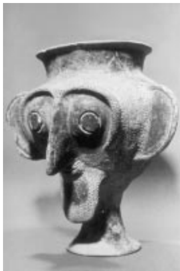
Сосуд для вина из Иерихона. XVII в. до Р. X.

Свт. Кирилл Иерусалимский (Огласительные слова, X, 11) указывал на образовательный смысл перехода народа Божьего через Иордан. Река, служившая как бы священным рубежом земли обетованной, стала символом,