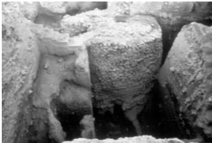
Иерихон, остатки крепости, построенной ок. 7000 лет до Р. Х. В центре – круглая сторожевая башня (высота – 10 м, диаметр – 13 м)

Дар Божий не легко получить тем, кто остается пассивным. Израиль должен был собрать все свои силы, чтобы одолеть стоящие на его пути препятствия. В этом призыве к активности, без которой дар Божий останется недостижимым, св. Отцы видели прообраз вхождения в Царство Божье, которое требует «усилий» (Мф 11:12). Знамения, сопровождавшие покорение Св. земли, означают небесную поддержку тем, кто борется.