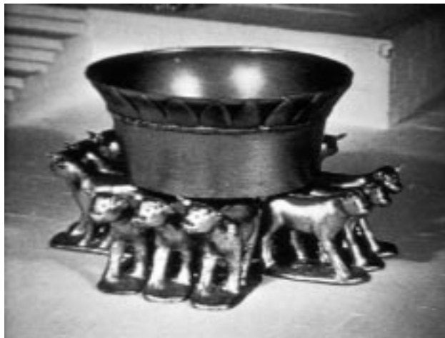
Бронзовый бассейн во дворе Храма – «медное море» (модель)

Тем самым Храм становится прообразом грядущей Вселенской Церкви.