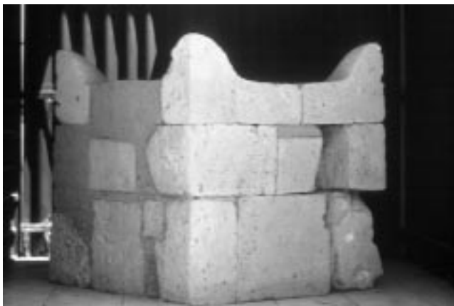
«Древний жертвенник», или «Рогатый алтарь из Вирсавии» (совр. Беер-Шева). IX в. до Р. Х.

ближней области, и израильтяне, поверив им, нарушили свое правило, поклявшись жить с ними в мире. Позднее, когда обман раскрылся, гаваониты стали вассалами Израиля. Раскопки показали, что Гаваон и после Иисуса Навина сохранял свое положение богатого торгового города.