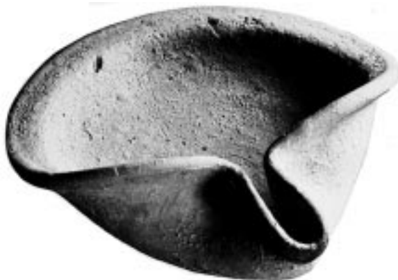
Масляный светильник. VIII в. до Р. Х.

ходят и ставят перед собранием. Над Саулом совершают обряд помазания, и права его торжественно провозглашаются и записываются в свиток.