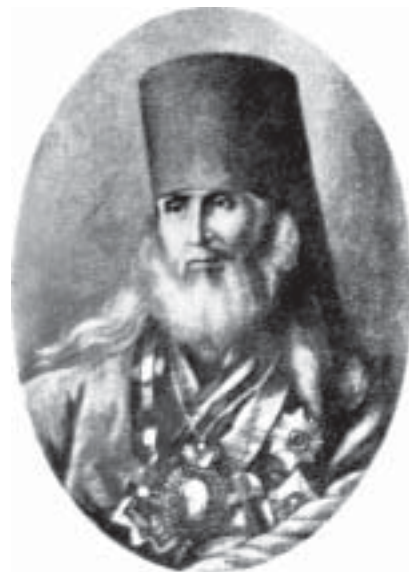
Архиепископ Филарет (Гумилевский)

В академии Ф. начал работать над курсом патрологии. Он стремился раскрыть всю живую многогранность свя-