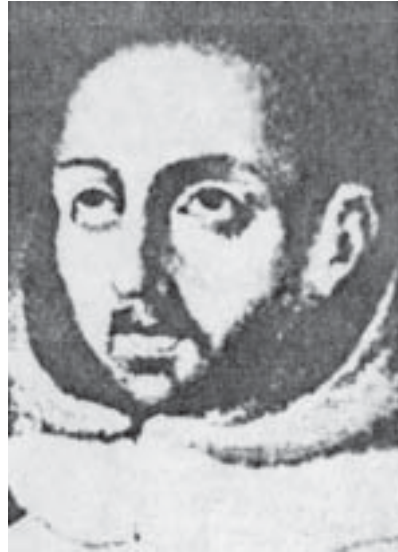
Хуан де ла Крус

ХУА́Н ДЕ ЛА КРУС (Juan de la Cruz), Иоанн Креста (де Йепес-и-Альварес), иером. (1542–91), испанский католич. мистик и поэт. Род. в обедневшей дворянской семье. Учился в ун-те Саламанки. В 1563 вступил в орден кармелитов. Рукоположен в 1567. В этом же году познакомился с Терезой Авильской и был вовлечен ею в дело реформы ордена. Борьба за преобразование кармелитских м-рей привела Х. де ла К. к тюремному заключению. В 1578 ему удалось бежать из темницы (с помощью Терезы). Последние го-