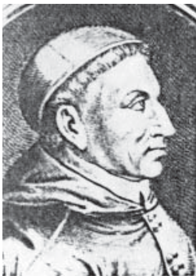
Кардинал Франсиско Хименес

ХИМЕНЕС (Ximénez, Jiménez) Франсиско, архиеп., кард. (1436–1517), исп. католич. церк. и государств. деятель. Учился в Саламанкском ун-те. В 1484 вступил в орден францисканцев. В 1492 был приближен ко двору и назначен духовником королевы Изабеллы Кас-