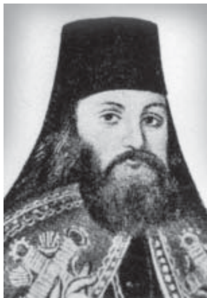
Архиепископ Феофан (Прокопович)

В 1702 в Почаеве Прокопович воссоединился с Рус. Правосл. Церковью и вскоре начал преподавать богословие, философию, риторику и поэтику в Киевской академии. Из западных странствий он вынес отрицат. отношение к католичеству и симпатию к протестантизму. Это вооружило против него правосл. богословов *Стефана (Яворского) и *Феофилакта (Лопатинского), к-рые высоко ставили лат.