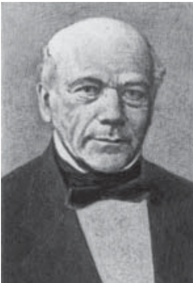
Иоганн Христиан Конрад фон Хофманн

ХОФМАНН (Hofmann) Иоганн Христиан Конрад фон (1810–77), нем. лютеранский библеист и богослов. Род. в Нюрнберге. Учился в ун-тах Эрлангена и Берлина. С 1845 и до конца жизни был профессором богословия в Эрлангене. Хотя Х. испытал влияние *Бенгеля, *Шлейермахера и *Гегеля, он остался ревностным приверженцем лютеранской ортодоксии. В своей работе «Пророчество и Исполнение в Ветхом и Новом Завете» («Weissagung und Erfüllung im Alten und Neuen Testa-