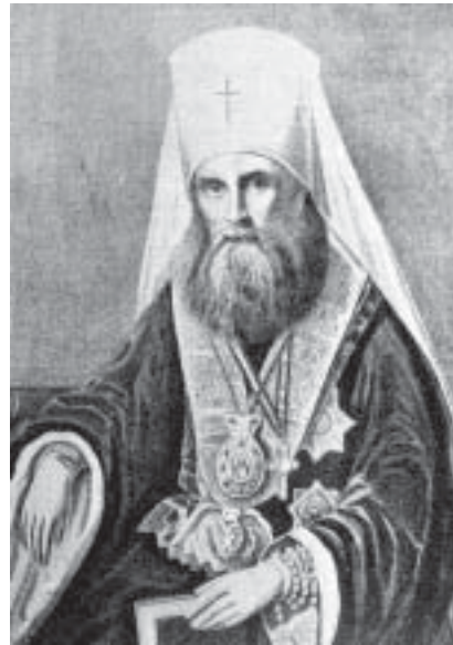
Митрополит Филарет (Дроздов)

Человек малого роста и хрупкого телосложения, Ф. отличался непреклонной волей, огромной работоспособностью и аскетическим настроем. Как и все незаурядные люди, он внушал самые различные чувства и вызывал противоположные о себе суждения. Консерваторы считали Ф. масоном и тайным протестантом, называя «якобинцем в богословии» и «карбонарием», либералы, напротив, видели в нем обскуранта. Особенно резко и одно-