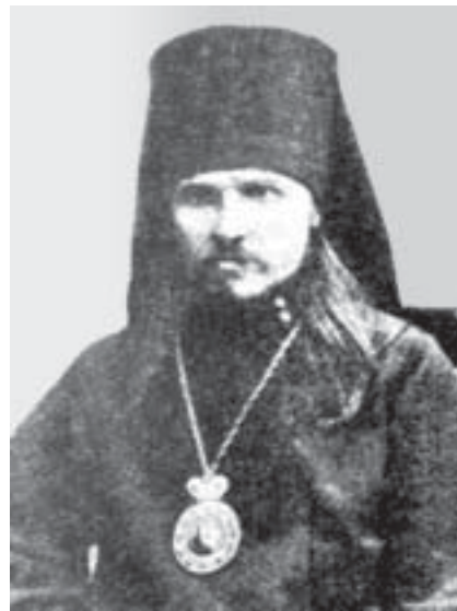
Епископ Фаддей (Успенский)

свидетельство приписывает книгу одному автору (Сир 48:22-25). Это предание отражено и в НЗ (напр., Лк 4:17-19; Деян 8:28-33), и в святоотеч. письменности. Упоминание во 2-й части Исцаря Кира, жившего на 200 лет позднее прор. Исаяи, Ф. объясняет пророч. даром предвидения. *Карташев характеризует труд Ф. как «последнюю попытку русской богословской школы отстоять единство книги прор. Исаяи». По его мнению, «после этой добросовестно-трудолюбивой попытки отстоять безнадежную позицию традицион-