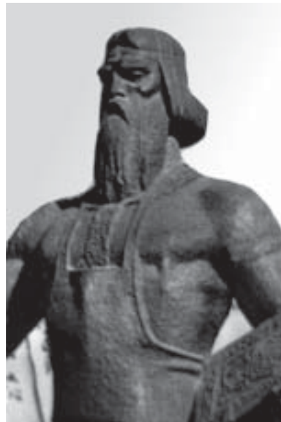
Фрагмент памятника И. Федорову во Львове

ФЁДОРОВ Иван (Иван Федорович Москвитин), диакон (ок.1510–83), рус. правосл. ученый, первопечатник. По преданию, Ф. род. в селе под Лихвином (на Оке). Предполагают, что он окончил Краковский ун-т, где получил