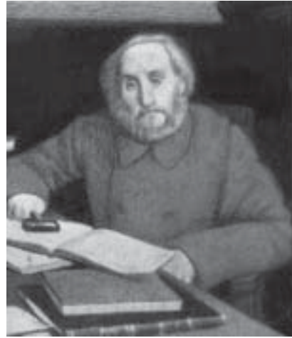
Даниил Авраамович Хвольсон

Х. входил в комиссию по работе над син. переводом ВЗ. По поручению этой комиссии он перевел *Пятикнижие, *Исторические книги ВЗ, Иов, Притч, Еккл. Кроме того, совместно с *Савваитовым Х. сделал русский перевод канонич. книг ВЗ с *масоретского текста для Британского библич. общества