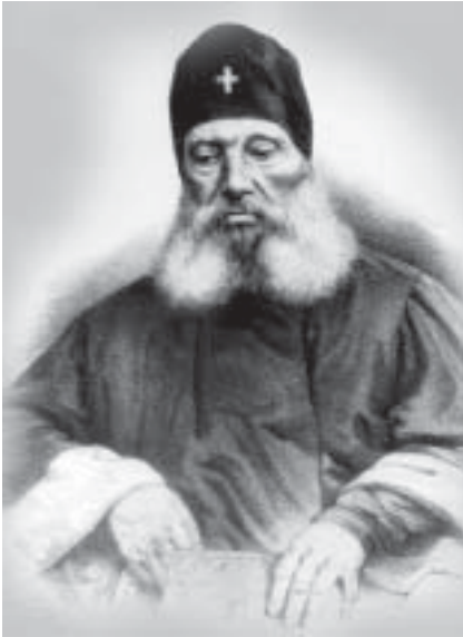
Митрополит Филарет (Амфитеатров)

в последние годы стал относиться к идее рус. перевода Библии отрицательно, хотя и не одобрял крутых мер его гонителей. «Я не могу, — писал он незадолго до смерти, — без глубокой скорби вспоминать, что верховное духовное начальство нашло необходимым предать огню на... кирпичных заводах несколько тысяч экземпляров пяти книг св. пророка Моисея, переведенных на русское наречие в с-петербургской духовной академии и напечатанных Библейским Обществом» (в связи с этим митр. Филарет Московский разъяснил, что в действительности истребление свящ. книг было сделано без прямой санкции священноначалия). На имя Ф. в 1841 поступил анонимный донос, указывающий на вредность распространения литографированных изд. перевода ВЗ, сделанного прот.*Павским. Митрополит ознакомился с переводом и переслал это, как он выражался, «нечестивое творение» обер-прокурору Н.А.Протасову. Так было по-