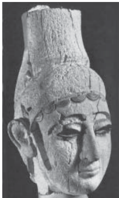
Фрагмент угаритской статуи

Ханаане, и в угаритских памятниках нет упоминаний о событиях ветхозав. истории. Однако тексты У. проливают свет на ряд дотоле неясных мест из ВЗ. Так, выяснилось, что древний мудрец-неизраильтянин Даниил, к-рого прор. Иезекииль (14:14) ставит в один ряд с Ноем и Иовом, — это герой угаритского эпоса Данэль, или, точнее, Даниилу. В Библии говорится о наро-