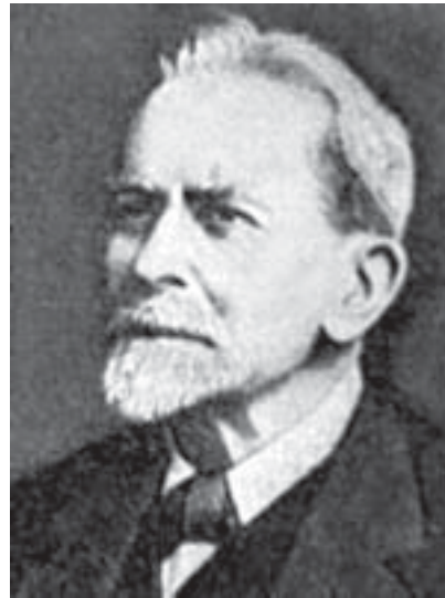
Джеймс Джордж Фрэзер

Ф. был избран чл. Британского королевского общества и получил множество ученых степеней. Странники