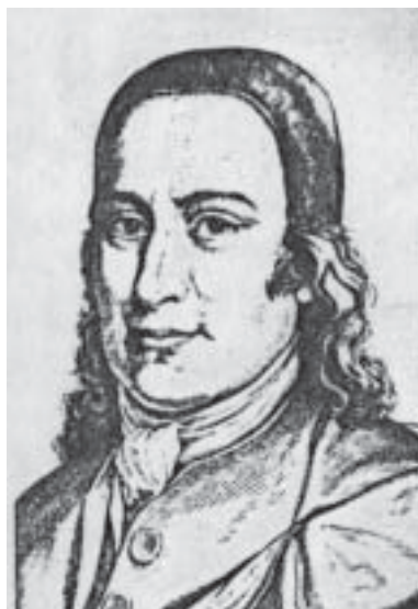
Николаус фон Цинцендорф

В 1727 Ц. завершил работу по переводу НЗ на нем. язык. Он уступал переводу *Лютера в точности и носил характер *парафраза. В нем заметно отразилось учение «чешских братьев». В 1737 от Д. А. Яблоньского, их епископа, Ц. принял хиротонию, но позднее отказался от епископства, заявив, что