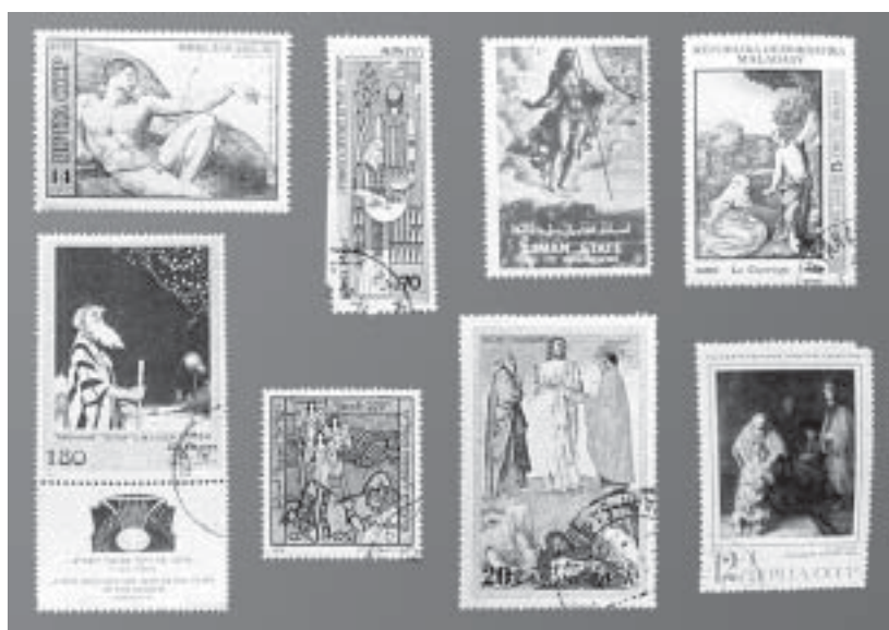
Марки с библейскими сюжетами

ФИЛАТЕЛИЯ БИБЛЕЙСКАЯ , отображение библ. тем и лиц на почтовых марках. Вскоре после издания первой почт. марки (Великобритания, 1840) стали появляться марки с художеств. гравюрами и возникла Ф., собирающая и изучающая эти знаки почтового обращения. Советская Ф. библейская включала гл. обр. марки, на к-рых воспроизведены творения великих мастеров на библ. темы (напр., *Микеланджело, *Рембрандта, *Эль Греко и др.), иногда такие марки издавались сериями (по художеств. галереям и ху-