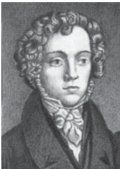
Эрнст Вильгельм Хенгстенберг

туозность диалектики и экзегезы... увлекательный и сильный, доходящий до поэтического воодушевления, тон, наконец, надо думать, крепкая и живая вера во Христа и в несокрушимость Его Церкви: вот качества, благодаря которым... Хенгстенберг стал главою всех, искавших опоры против неверия и полуверия». Х. считал, что долг ортодоксии отстаивать *старую исагогику, в частн., *авторство Моисея для всего *Пятикнижия (при этом он допускал, что Еккл написан после Плена). Его перу принадлежат многочисл. библ. комментарии (на Пс, Песн, Еккл, Иез, Откр и др.), а также книги «Очерки к введению в Ветхий Завет» («Beiträge zur Einleitung ins AT», В., 1831), «Книги Моисея и Египет» («Die Bücher Moses und Aegypten», В., 1841), «Христология Ветхого Завета» («Christologie des Alten Testaments», Т.1–3, В., 1829–35). Посмертно вышла его «История Царства Божия во времена Ветхого Завета» («Geschichte des Reiches Gottes unter dem Alten Bunde», Т.1–3, В.–Lpz., 1869–71).