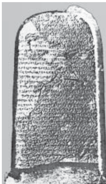
Стела моавитского царя Меши

Хронологические рамки и датировка. 1–4 Цар являются продолжением Суд и охватывают период с 11 в. по