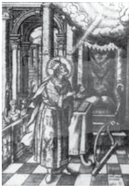
Царь Давид. Гравюра Ушакова к переводу Псалтири Симеоном Полоцким

цы в Никитниках. У. создал гравюры к поэтич. *парафразу Псалтири, написанному *Симеоном Полоцким. У. — один из первых рус. мастеров, к-рый стал вводить в иконопись элементы реалистич. перспективы, хотя основы иконописных канонов были им сохранены. Впрочем, как отмечает М.Б.Алпатов, «в своем творчестве он допускал меньше новшеств, чем в высказываниях об искусстве».