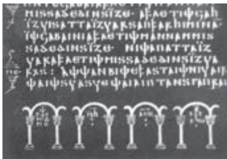
Фрагмент готского перевода «Серебряный кодекс»

К проблеме авторства «вульфиланского» перевода, в кн.: Проблемы сравнит. филологии, М.–Л., 1964; Самулов В., История арианства на лат. западе (353–430), СПб., 1890; Thompson E.A., The Visigoths in the Time of Ulfil, Oxf. (USA), 1966; проч. библиогр. см. в ODCS, p.1404.