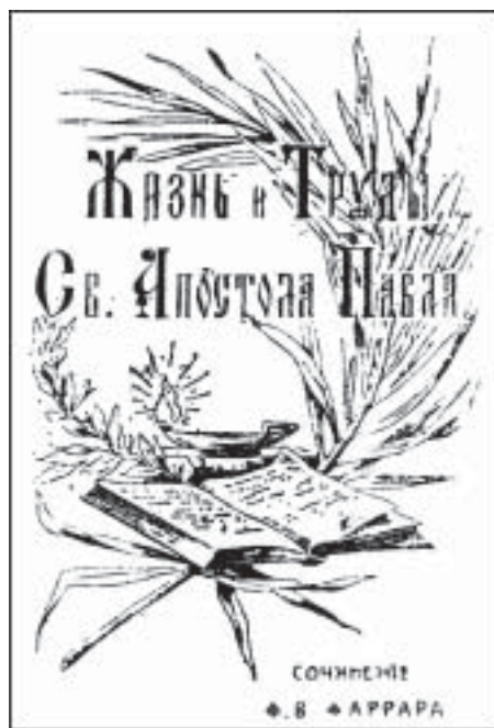
Титульный лист сочинения Ф.У. Фаррара

ские, а также труды мн. своих предшественников и современников. При этом он не стремился превратить трилогию в сугубо спец. труд, а рассчитывал на широкий круг образованных читателей. Его книги отмечены художеств. изложением и богосл. насыщенностью. *Исагогике Евангелий он уделяет мало места, зато подробно останавливается на проблеме происхождения посланий и Апокалипсиса (в частн., он признает все Павловы послания принадлежащими апостолу, за исключением Евр).