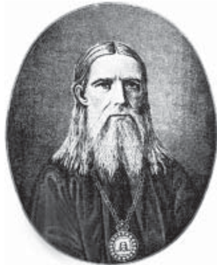
Епископ Феофан (Говоров)