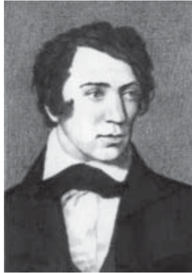
Алексей Степанович Хомяков

Род. в Москве в старинной дворянской семье. Большое влияние на Х. имела мать, воспитавшая его в правосл. традиции, к-рой он остался верен