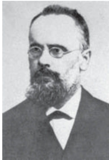
Анатолий Алексеевич Спасский

Один из важных вопросов новозав. *исагогики С. рассмотрел в монографии «Св.Иустин и синоптические Евангелия» (ПО, 1889, № 5–6). В ней он тщательно проанализировал ссылки *Иустина Философа на апостольские писания о жизни Христа и пришел к выводу, что святому были известны все три *синоптических Евангелия. С. принадлежит также сокр. перевод книги *Гарнака о хри-