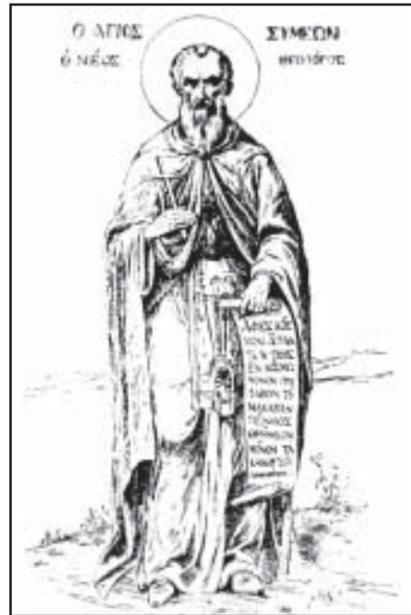
Преподобный Симеон Новый Богослов. Рисунок пером М.В. Боскина по древней фреске Афонского монастыря Пантократора

Чтение Библии и размышление над ней С.Н.Б. считал незаменимой духовной пищей (там же, 12, 1 сл.). Пережив опыт благодатного озарения, подвижник видел в нем гл. цель христ. жизни. Он много писал о тайне первородного греха и о возрождении человека силой