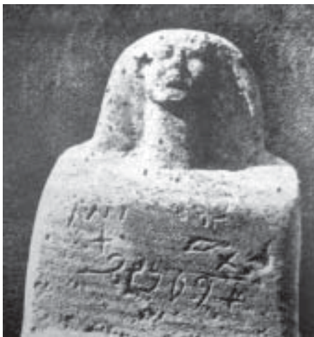
Образец синайского письма на статуе

С.п. представляет собой нечто среднее между рисуночным письмом *иероглифов и буквенным письмом семитских *алфавитов. В 1916 англ. египтолог Алан Гардинер выдвинул гипотезу, согласно к-рой С.п. было изобретено семитскими племенами, обитавшими на Синае и работавшими на рудниках фараонов. Эту гипотезу поддержал *Олбрайт (1948) и др. видные специалисты. Расшифровка С.п.