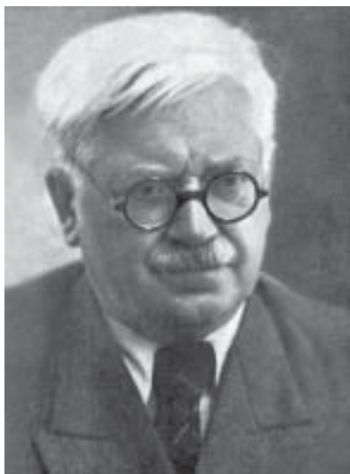
Василий Васильевич Струве

Ханаан «народов моря». По его мнению, бедуины, прибывшие в Египет, тождественны семье Иакова, а Ирсу — Иосифу. На этом основании С. пересмотрел всю *хронологию Исхода (переселение в Египет он отнес к 1230, а Исход — к нач. 12 в. до н. э.).