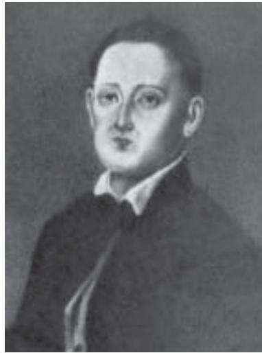
Григорий Саввич Сковорода

СКОВОРОДА Григорий Саввич (1722–94), укр. философ и поэт. Род. в с.Чернухи Полтавской губ. в семье малоземельного казака. Учился в Киево-Могилянской академии (1738–42, затем 1744–50). Был одним из образованнейших людей своего времени, хорошо знал древние и новые языки, писал поэмы, басни, филос. диалоги. Много странствовал по Европе. После неск. лет преподавательской работы С. в 70-х гг. окончательно избрал путь независимости и стал странствующим мудрецом. Почти все его произведения были опубликованы посмертно.