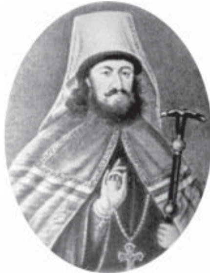
Митрополит Стефан (Яворский)

СТЕФА́Н (Симеон Иванович Яворский), митр. (1658–1722), рус. правосл. церк. деятель, богослов и философ. Род. на украинском Правобережье в правосл. семье. Рано проявил разносторонние таланты. После присоединения Правобережья к Польше семья С. переселилась на Левобережье, и в 1673 С. поступил в Киево-Могилянскую коллегию, где изучил лат. и греч. языки и овладел основами научных знаний. Чтобы получить образование в польских и литовских школах, он вынужден был присоединиться к католицизму. В 1689 С. вернулся в ло-