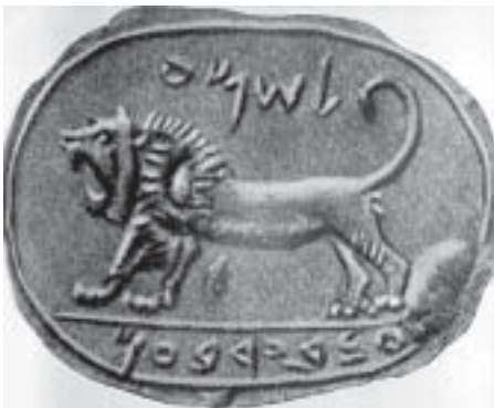
Печать Шемы, слуги Иеровоама II. 8 в. до н. э.

Эта форма печатей распространилась и в Израиле. На территории древней Палестины был найден ряд печатей, имеющих прямое отношение к библ. истории. Среди них печать с изображением крылатого сфинкса и над-