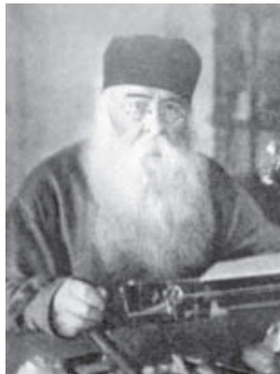
Патриарх Сергий (Страгородский)

СЕРГИЙ (Иван Николаевич Страгородский), Патриарх Московский и всея Руси (1867–1944), рус. правосл. церк. деятель и богослов. Род. в Арзамасе Нижегородской губ. в семье священника. Окончил СПб.ДА (1890), приняв на последнем курсе монашество. В 1890–93 трудился на миссионерском поприще в Японии. По возвращении из Токио в течение 9 мес. вел курс Свящ. Писания НЗ в СПб.ДА, а затем был направлен архимандритом по-