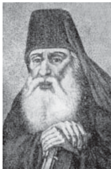
Иеромонах Симеон Полоцкий

СИМЕОН ПОЛОЦКИЙ (Самуил Гаврилович Петровский-Ситнианович), иером. (1629–80), белорусский и рус. духовный писатель, публицист, поэт. Род. в Полоцке. Учился в Киево-Могилянской академии и польской коллегии Общества Иисусова. В 1656 принял постриг в Полоцком Богоявленском м-ре и стал преподавателем в школе «правосл. братства». После занятия Полоцка поляками в 1664 С.П. переселился в Москву, где его пи-