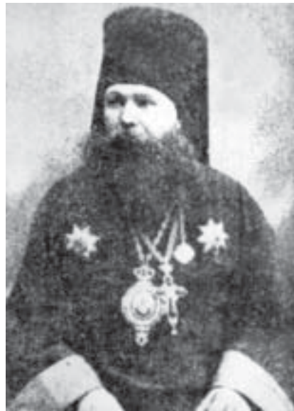
Митрополит Серафим (Мещеряков)

СЕРАФИ́М (Иаков Мещеряков), митр. (1861–1937), рус. правосл. церк. деятель и писатель. Род. в Пензенской губ. в семье крестьянина. Окончил СПб.ДА (1885) и был рукоположен во иеромонаха. Состоял инспектором Холмской ДС и ректором Тифлисской ДС. В 1889 удостоился степени магистра за работу о прорицателе Валааме. Хиротонисан в 1898 во еп.Острожского; затем последовательно занимал кафедры Полоцкую и Иркутскую. С 1915 по 1922 управлял м-рями в Красноярской и Костромской епархиях. В 1922 после назначения на Костромскую кафедру примкнул к «обновленческому» расколу. Вернулся в юрисдикцию Московской Патриархии, пройдя через покаяние (1924). С 1928 – архиепископ, а затем митр. Ставро-