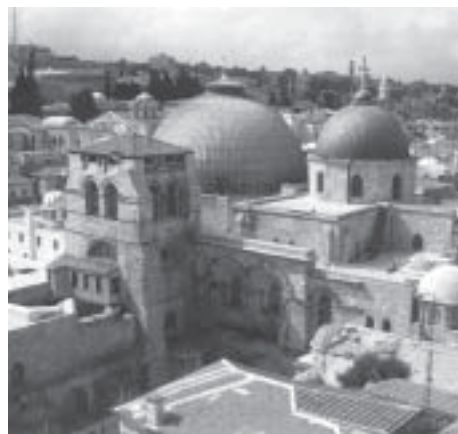
Храм Гроба Господня в Иерусалиме

Однако большинство археологов считает наиболее достоверной ту топографию Страстей Христовых, на к-рую указывает древнецерк. предание. Они полагают, что нынешний храм Гроба Господня и Голгофы стоит над тем местом, где находился холм Распятия и расположенная близ него пещерная усыпальница Иосифа Аримафейского. Остатки старой стены, отделяющей Голгофу от города, были найдены при раскопках, проводившихся *Русской духовной миссией под руководством архим.* Антонина (Капустина). В 1965