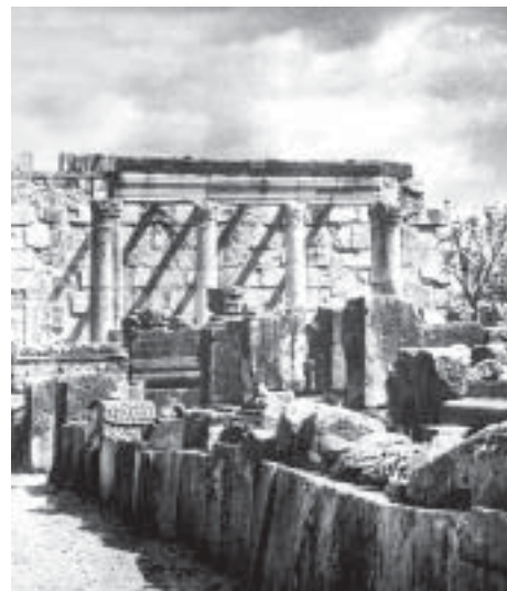
Развалины синагоги в Капернауме

Во *Второго Храма период, несмотря на восстановление жертвоприношений, обычай молиться и читать Писание вне Храма сохранился. Так возникли «дома собрания», или, по-гречески, синагоги. Они сооружались не только в *Палестине, но и в *диаспоре, где почти каждая иудейская община имела собственный молитв. дом. Нек-рые из них отличались обширными размерами и роскошным