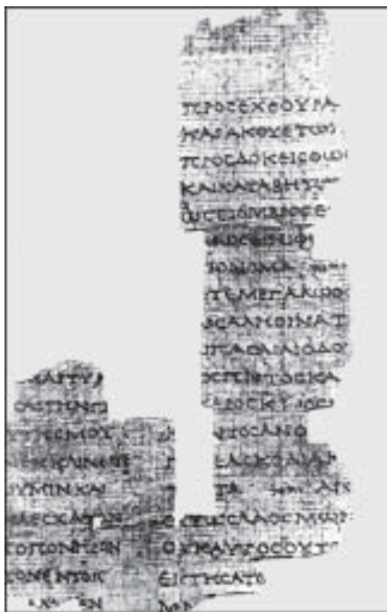
Фрагмент папируса 2 в. до н.э. с текстом Септуагинты

Рукописи и издания. Древнейшие рукописи С. – это фрагменты египетских папирусов 3–2 вв. до н.э., т.е. современных самому переводу. Примечательно, что свящ. имя Божье, Яхве, написано в них не греч., а древними