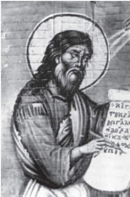
Пророк Захария. Миниатюра из Книги пророков. XIII в. Рим. Библиотека Ватикана

сом, сыном Иоседековым, но, как полагают мн. экзегеты, первоначально здесь стояло имя Зоровавеля, князя из дома Давидова (6:9-15). Завершается 1-я часть книги наставлением о посте и картиной возрожденного Града Божьего.