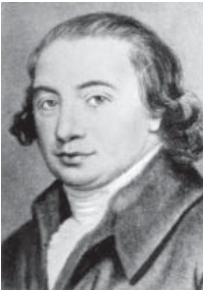
Иоганн Соломон Землер

З. сводил христианство к морали и личному благочестию и утверждал, что боговдохновенным в Библии является только то, что не выходит за эти рамки (чем объясняется любовь З. к *аккомодическому толкованию). Что касается *противоречий в Библии, то З. признавал их возможность только в сфере историч. «формы» Писания, но отрицал их в самом духовном его содержании (т.е. в той сущности Писания, к-рую признавал боговдохновенной). Если же и в этой области отме-