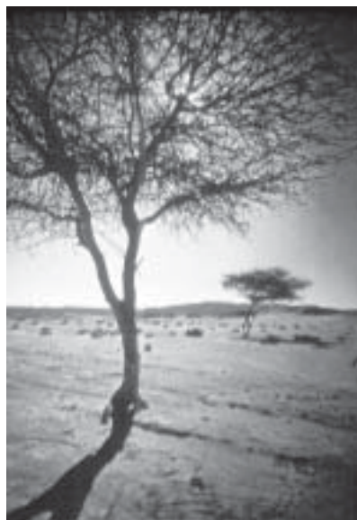
Синайский полуостров. Пустыня Фаран. Акация — дерево, способное выжить в условиях пустыни.

Следует отметить, что наряду с реальными животными в Библии нередко фигурируют чудовища, символизи-