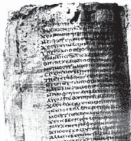
Манускрипт Евангелия от Фомы

Евангелие Никодима, или Деяния Пилата , написано с целью уменьшить