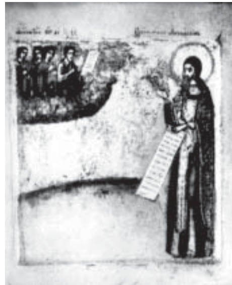
Протопоп Аввакум. Икона. Нач. 18 в. Государственный исторический музей

Род. в нижегородском краю в семье сел. священника. В 1644 был рукоположен в иерея. С начала служения вступил в конфликт с окружением. В 1647 вынужден был бежать в Москву, где примкнул к «кружку ревнителей благочестия» и повел борьбу против упадка нравов. Подобно *Савонароле, А. признавал себя пророком, призванным обличать и наставлять. Церк. реформу, проводимую царем Алексеем Михайловичем и патр. Никоном, А. не принял, вследствие чего стал объектом жестоких гонений. Попытки царя и иерархии привлечь его на сторону реформы оказались безуспешными. А. осудили на Соборе, бросали в тюрьмы, ссылали в монастыри, но он остался непреклонен. В 1667 выслан на север, в Пустозерск. В изгнании продолжал борьбу, сочинял послания, проповеди, библ. толкования, составил автобиографию. На седьмом году царствования Феодора Алексеевича А. был казнен (заживо сожжен в срубе) вместе с тремя единомышленниками. А. — один