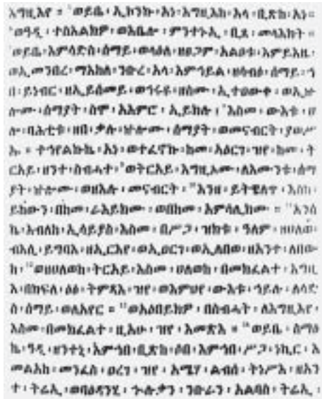
Эфиопский перевод Книги Еноха

в) притчи (37–71); г) небесные светила (72–82); д) видения (83–90); е) призыв к праведности (91–105); ж) заключение (106–108), включающее Кн. Ноя (106–107).