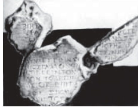
Надпись императора Клавдия

г) Под алтарем базилики св. ап. Петра в Риме найдено старое кладбище императорской эпохи и остатки древней гробницы апостола. В ее стене — обломок колонны. Его считают частью памятника, воздвигнутого над местом погребения апостола во 2 в. (Этим временем датируются монеты в гробнице и надписи с упоминанием ап. Петра).