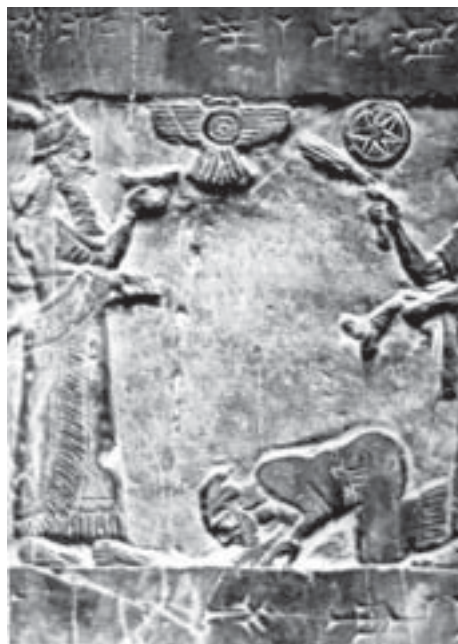
Обелиск Салманасара III. Ассирийский рельеф. Черный базальт. 9 в. до н. э.

н) В 1956 была опубликована Нововавилонская летопись, в к-рой освеще-