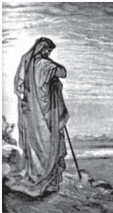
Пророк Амос. Гравюра Г. Доре

Содержание и композиция книги. Пророчества Амоса сгруппированы в 4 частях: 1) обличение грехов Израиля, Иудеи и народов, их окружавших: сирийцев, филистимлян, финикийцев, идумеев, аммонитян и моавитян (1—2); 2) суд Божий над ветхозав. Церковью, призыв к покаянию (3—6); 3) семь видений, означавших грядущий Суд (7:1—9:10); 4) пророчество о восстановлении «скинии Давидовой» (Мессианское Царство) (9:11-15). Т.о., главное содержание книги — Суд и покаяние. В ней господствует родственный духу Иоанна Крестителя суровый дух, пробуждающий совесть. Пророк беспощадно разрушает религ. иллюзии своих современников как самооболь-