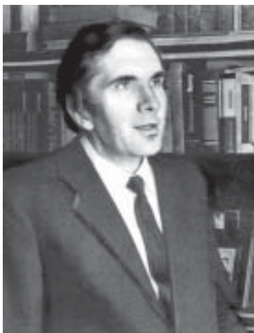
Сергей Сергеевич Аверинцев

р. 411 ff.; JBS, v. 1, p. 443—5 (здесь же см. библиогр. на иностр. яз.).