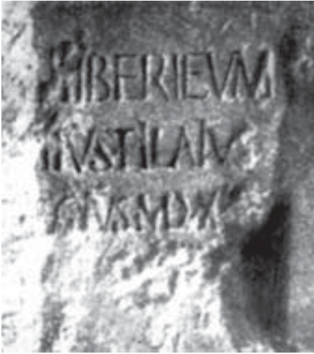
В надписи, высеченной на камне, упоминается имя Понтия Пилата. Найдена в Кесарии в 1961 г. Иерусалим. Музей Израиля

к) В 1962 найдены самаритянские папирусы 4 в. до н.э. Они касаются истории Палестины в период, когда иран. господство сменилось греческим. В них упоминается Санаваллат, потомок Санаваллата, современника Неемии.