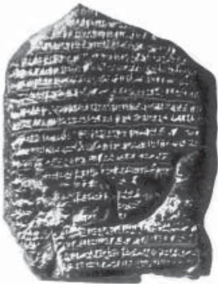
Нововавилонская летопись. Британский музей, 6 в. до н. э.

а) Раскопки древнеханаанских городов (Асора, Хеврона, Давира и др.) показали, что в кон. 13 в. до н.э. они были разрушены и сожжены, что согласуется с данными Кн.Иисуса Навина. В то же время Гаваон оказался процветающим в ту эпоху торговым городом, что также соответствует рассказу Библии. Сложнее дело обстоит с Иерихоном. Этот древнейший в мире город, основанный за 9 тыс. лет до н.э., разрушался не раз. Экспедиция К.*Кеньон установила, что слой 13 в. до н.э. (эпоха Ис Нав) не содержит почти никаких