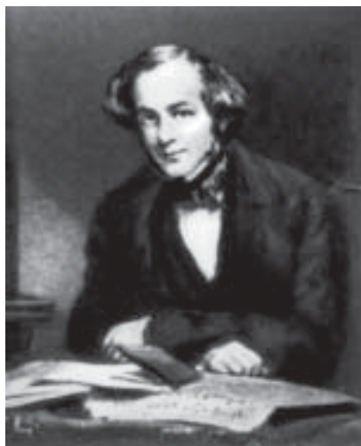
Генри Кресвик Роулинсон

● *Вулл Л., Ур халдеев, пер. с англ., М., 1961; Бузескул В.П., Открытия XIX и начала XX вв. в области истории