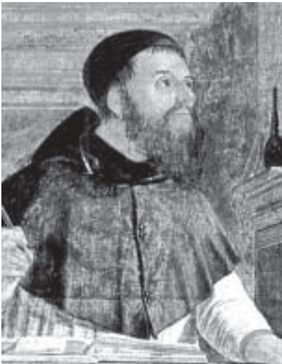
Видение св. Августина. Картина В. Карпаччо. Фрагмент. Венеция

Августин как экзегет. А. принадлежит большое число экзегетич. работ: «Вопросы на Евангелие» («Quaestiones Evangeliorum»), «О Нагорной проповеди» («De sermone Domini in monte»), «На некоторые части Послания к Римлянам», «На Послание к Галатам», «На различные вопросы», «О согласии евангелистов» («De consensu Evangelistarum»; рус. пер.: Творения, ч.10, К., 1906), «О Книге Бытия, буквально» («De Genesi ad litteram», libri, XII; рус. пер.: Творения, ч.7—8, К., 1893—95), «На Псалмы» («Enarrationes in Psalmos»), «На Книгу Иова», «О формах выражения в Свящ. Писании», «О духе и письме» («De Spiritu et Littera»; рус. пер.: М., 1787), «На Евангелие от Иоанна» («In Joannis Evangelium tractatus»), «Зерца-