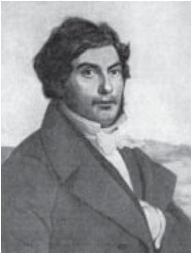
Жан Франсуа Шампольон

ровку текстов. Результаты библ. А. также помогают в уяснении смысла библ. книг, реконструируя историч. фон их написания.