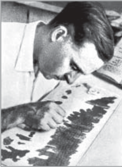
Джон Марко Аллигроу

лем кумранской секты Учителем Праведности и Иисусом Христом, А. писал: «Мы должны быть достаточно осмотрительны на этой стадии изучения проблемы, чтобы избежать безапелляционных предположений о жизни Учителя и обстоятельствах его смерти и слишком поспешных сравнений с христианским Учителем, об истории которого до нас дошло слишком мало, чтобы все принять как неопровержимый факт». А. отмечал многие параллели в евангельских рассказах об Иоанне Крестителе с данными кумранских свитков. Он не исключает возможности, что Иоанн в юные годы жил среди ессеев. Однако, пишет он, «когда мы встречаемся с ним, он уже не является членом секты. Это может означать либо исключение, либо, возможно, добровольный уход именно в то время, когда его целиком захватило убеждение, что он должен возвестить свою миссию простым людям».