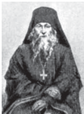
Архимандрит Антонин (Капустин)

А. принадлежит перевод с комментариями труда нем. египтолога Ф.Й. Лаута (1822–95) «Фараон, Моисей и Исход» (ТКДА, 1875, № 11–12) и перевод фрагментов из *Иосифа Флавия (там же). В библиотеке Синайского монастыря А. исследовал мн. *рукописи библейские (Феодосиево Евангелие, Кассиева Псалтирь и др.) и сделал ценные палеографич. наблюдения. В 1883 под руководством А. были произведены раскопки в Иерусалиме, в результате к-рых обнаружили древние городские стены (описаны им в соч.