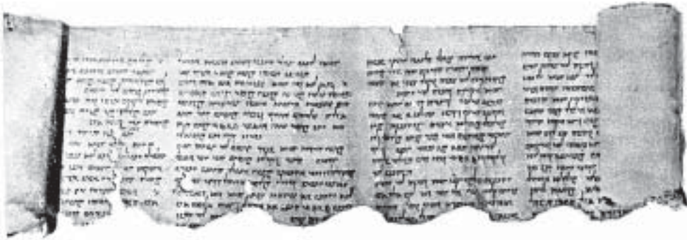
Фрагмент толкования на Книгу пророка Аввакума. Кумран. 1 в. до н. э.

так как нечестивый одолевает праведного, то и суд происходит превратный. (1:3-4)