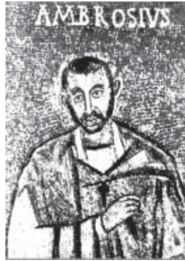
Святитель Амвросий Медиоланский. Мозаика в церкви Сан Амброджио. Милан. Ок. 470 г.

Экзегетические творения: «Шестоднев» («Hexameron»), «О Рае» («De paradiso»), «О Каине и Авеле» («De Cain et Abel»), «Апология пророка Давида» («De apologia proph. David»), «О Товите» («De Tobia»), «Изложение Евангелия от Луки» («Expositio Evangelii sec. Lucam»), «Изложение псалма 68» («Expositio de psalmo LXVIII»), «О Ное и ковчеге» («De Noe et arca»), «Об Аврааме» («De Abraham»), «Об Исааке» («De Isaac vel anima») (содержит также толкование на Песнь Песней), «О Иакове и блаженной жизни» («De Jacob et vita beata»), «Об Иосифе патриархе» («De Joseph patriarcha») (Иосиф как прообраз Христа), «О патриархах» («De patriarchis»), «О суде над Иовом и Давидом» («De interpellatione Iob et David»), «Об Или и посте» («De Helia et ieiunio»), «О Навуфее израильтянине» («De Nabutha esraelita») (обличение богачей), «Толкования на 12 псалмов» («Explanatio super psalmos duodecim»). Ряд толкований находит-