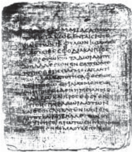
Рукопись Евангелия св. Иакова

вину Пилата за осуждение Господа. Датируется 2–4 вв. Сохранилось в греч., слав. и частично в лат. версиях.