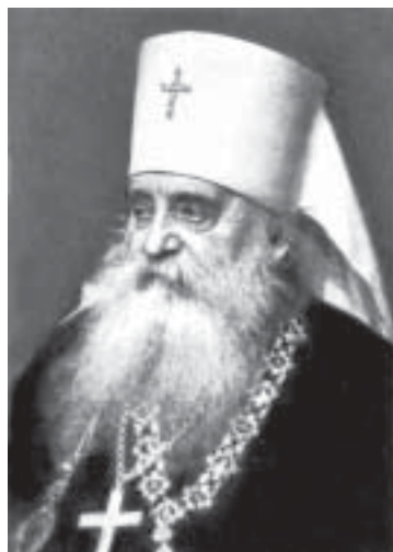
Митрополит Антоній (Храповицкий)

Его многочисл. публицистич. и богосл. работы касались обществ. вопросов, догматики, пастырства, библеистики. Лит. и церк. деятельность А. носила противоречивый характер. С одной стороны, он резко критиковал синодальные и государств. порядки, с другой — смыкался с правыми, «охранительными» силами. Был активным сторонником движения по возрождению патриаршества и одним из кандидатов на каф. первосвященителя. Эмигрировав в 1920, оказался в среде монархистов-реставраторов. С 1921 и до конца жизни возглавлял «карловацкий» раскол