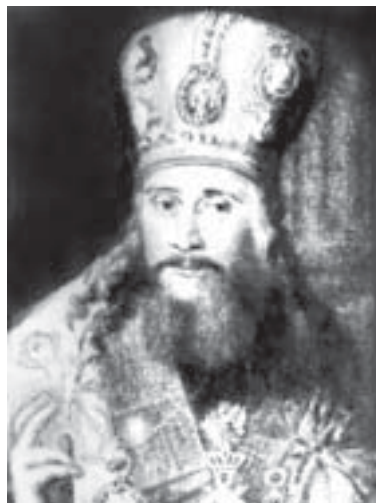
Митрополит Амвросий (Подобедов)

Содействовал церк.-педагогич. делу в России и преобразованию духовных школ. Был первым в России почетным доктором богословия. После конфликта с кн. Голицыным был уволен на покой и вскоре скончался. А. принадлежит «Краткое руководство к чтению книг Ветхого и Нового Завета» (К., 1823 2 , М., 1840 6 ). Труд этот носит не научный, а учебно-компилятивный характер.