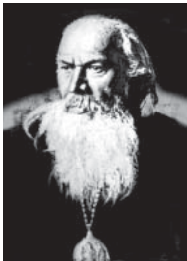
Епископ Антонин (Грановский)

● Еп. А. (Грановский), «Странник», 1914, № 3; Мануил. РПИ, т. 1, с. 331; ПБЭ, т. 1, с. 197.