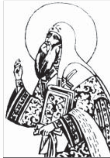
Святитель Алексий (Бяконт). Прорись

АЛЕКСИЙ (Елевферий Федорович Бяконт), свт., митр. Киевский и всея Руси (ок.1295—1378), подвижник духовного просвещения и возрождения Руси в эпоху владычества Золотой Орды. Сын черниговского боярина, к-рый