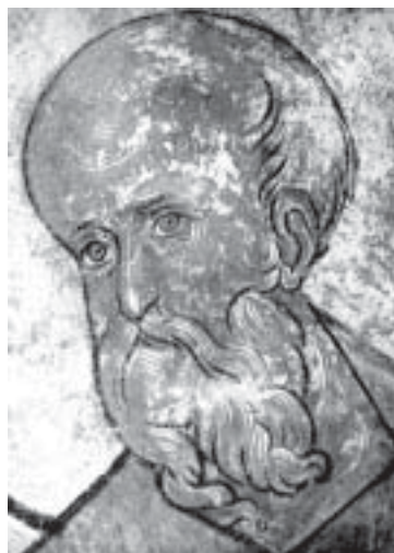
Св. Иоанн Богослов. Фреска Андрея Рублева из Успенского собора во Владимире. 1408 г.