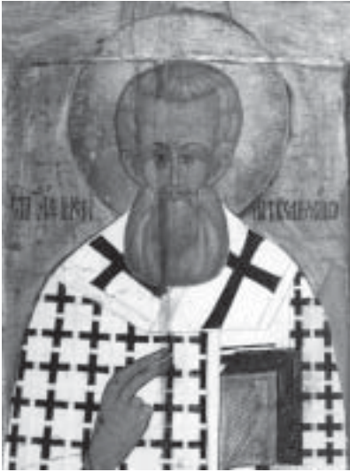
Святитель Афанасий Великий. Икона. Русский Север. 16 в.

вел вне кафедры). Пользовался горячей любовью народа. В защите православия от подрывавшего основы Церкви арианства проявил несгибаемую волю и мужество. А.В. не получил, в отличие от многих св. отцов, основательного образования, но его проникнутые верой вдохновенные писания вошли в золотой фонд патристич. наследия. А.В. стал одним из основоположников христ. агиографии, написав житие прп. Антония Великого.